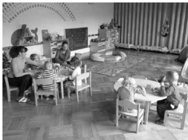
Mateřská škola v hale