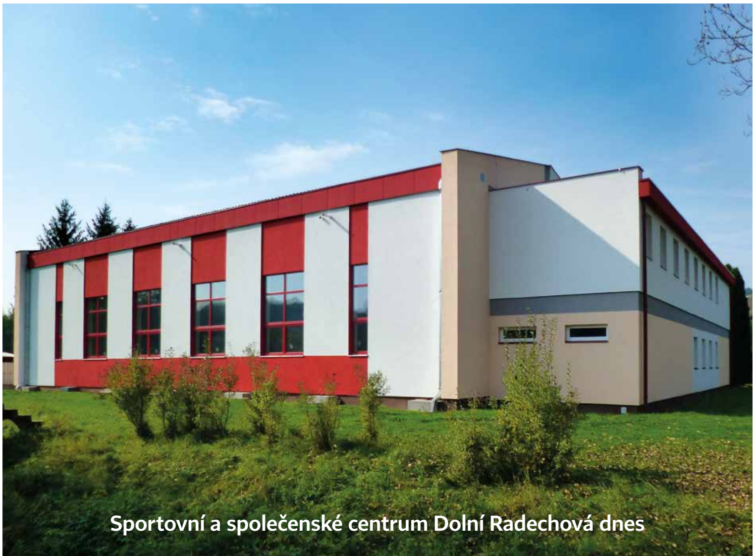
Sportovní a společenské centrum Dolní Radechová dnes