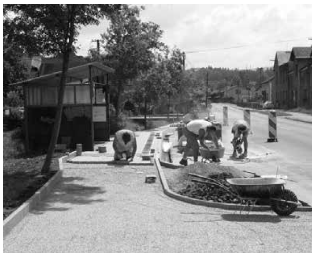
Stavební úpravy přechodu pro chodce